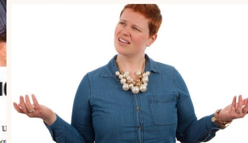
Enligt en ny undersökning har en av fyra svenskar svårt att förstå basal ekonomi.

En ny undersökning från Finansinspektionen visar att en av fyra svenskar saknar grundläggande kunskaper om ekonomi.