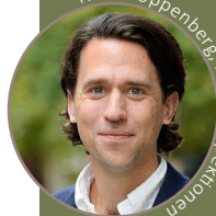
Niklas Uppenberg, Finansinspektionen

Ta del av presentationen från seminariet här .