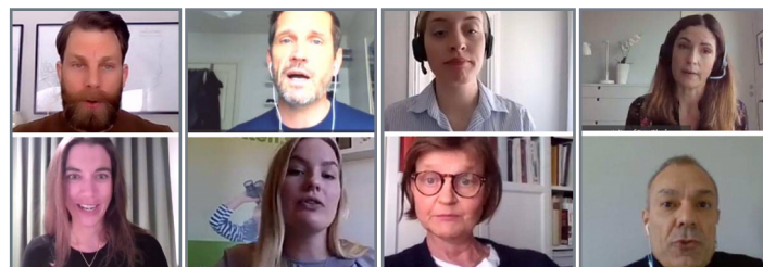
Några av våra föreläsare under en av vårens digitala kurser.

Vi vill även passa på att rikta ett stort tack till våra fantastiska föreläsare som gjort ett lysande jobb under våren - tillsammans sprider vi kunskaper i privatekonomi!